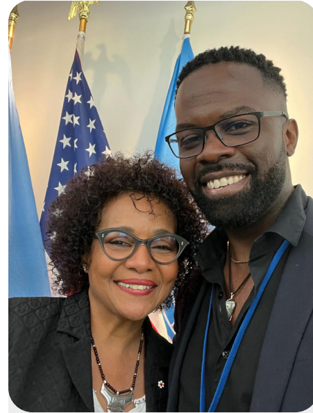
© Forum Permanent des Nations Unies pour les Personnes d'Ascendance Africaine avec Michaëlle Jean et Louis-Edgar Jean-François / Droits réservés