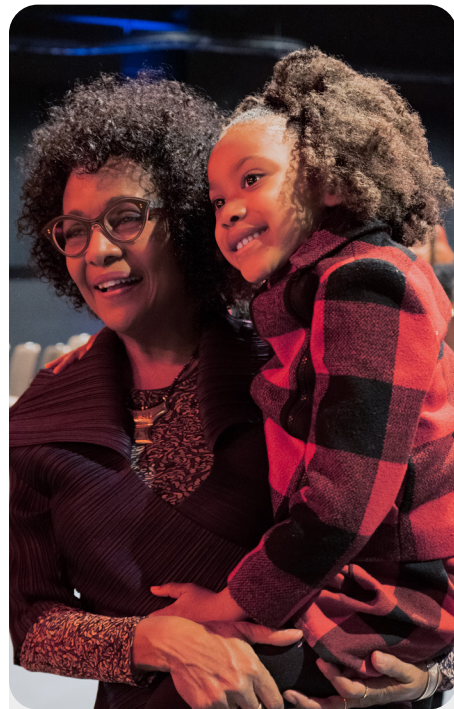
Lancement de la déclaration d'Halifax avec Michaëlle Jean